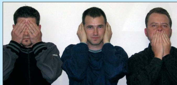
Hálóőrök: Norbi, Bob, Balna84

Kiadja: Tordas Értékmegőrző-fejlesztő és Kulturális Közhasznú Egyesület Felelős kiadó: Cifka János Szerkeszti: a szerkesztőbizottság Honlap: www.tordas-ert.hu Megjelenik: 600 példányban Ingyenes!